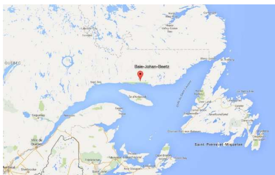
Figure 1 : Localisation du village de Baie-Johan-Beetz

La Municipalité de Baie-Johan-Beetz est une municipalité faisant partie de la MRC de Minganie, à environ 300 km au nord-est de Sept-Îles. Elle couvre 340 km carrés le long du littoral du Golfe Saint-Laurent et son milieu physique est la taïga.